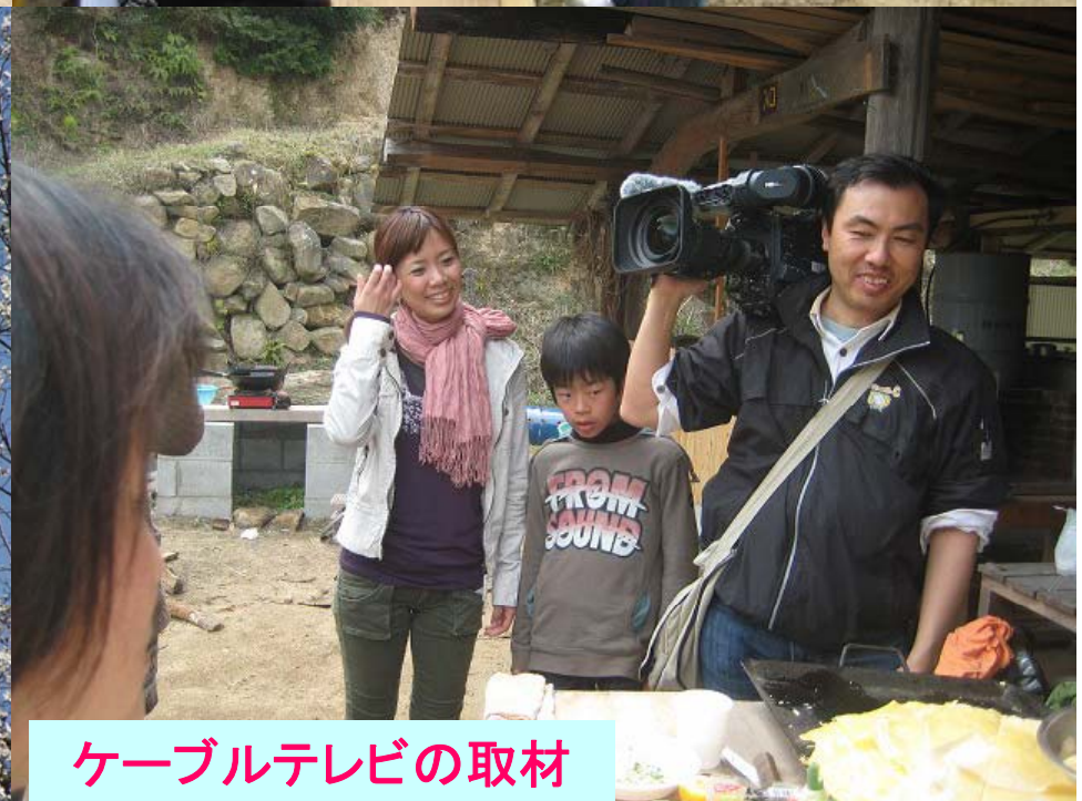
ケーブルテレビの取材