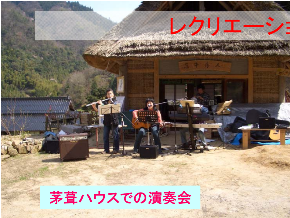
茅葺ハウスでの演奏会