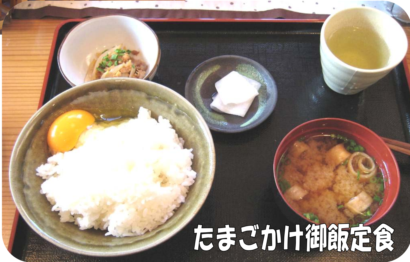
たまごかけ御飯定食