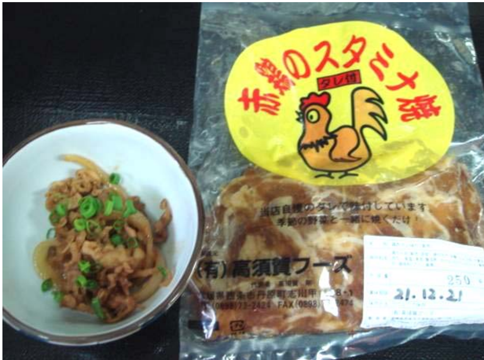
親鳥を使用した「赤鶏のスタミナ焼」