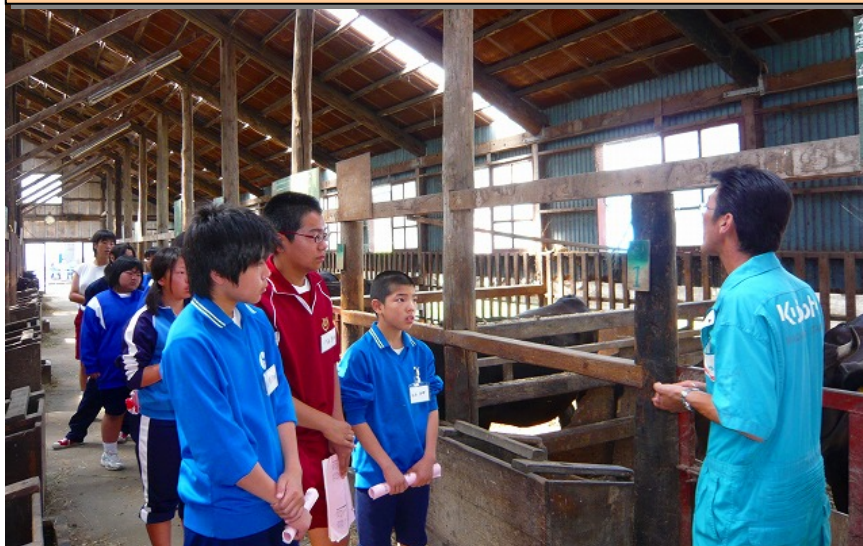
ボランティア体験の受け入れ