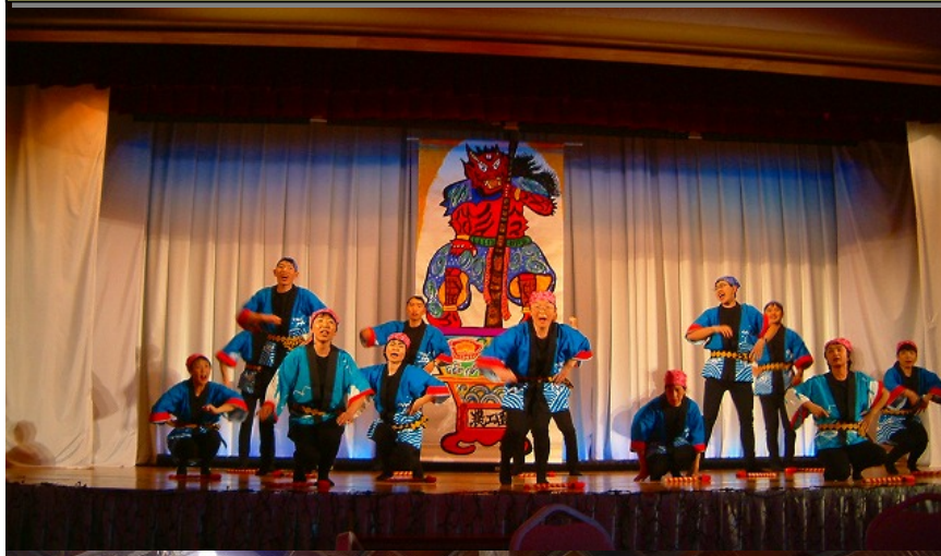
ボランティア体験の受け入れ