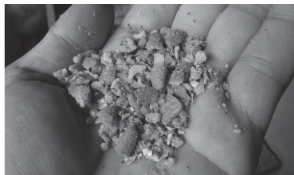
(写真5) 菓子生地・せんべい等を利用したエコフィード

養豚一貫経営では、LW母豚にデュロック種（D）の雄豚を交配した三元交雑LWDを出荷する方式が主流であり、当該経営は20年ほど前からLW母豚は全て自家生産している。人工授精用精液は自家採取を積極的にを行い、繁殖に係る一連の作業は地域外からの要素を極力入れないように心がけている。このことが、PRRS清浄化の維持や衛生レベルの高位安定化につながり、平成18年には新潟県畜産協会が認定する畜産安心ブランド生産農場（クリーンポーク生産農場）に認定され、今も基準に沿った衛生対策を継続している。