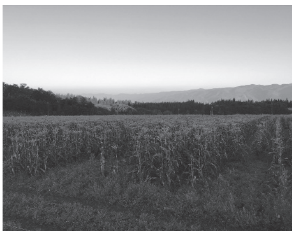
(写真6) 広大なスイートコーン畑

フリーストールを導入した平成21年から、発酵済タマゴや食品残さ由来飼料、最近では菓子生地や煎餅屑などのエコフィードを肥育豚に給餌している。給餌量の約20%を配合飼料からエコフィードに代替することで、年間約260万円のコスト低減につながっている。