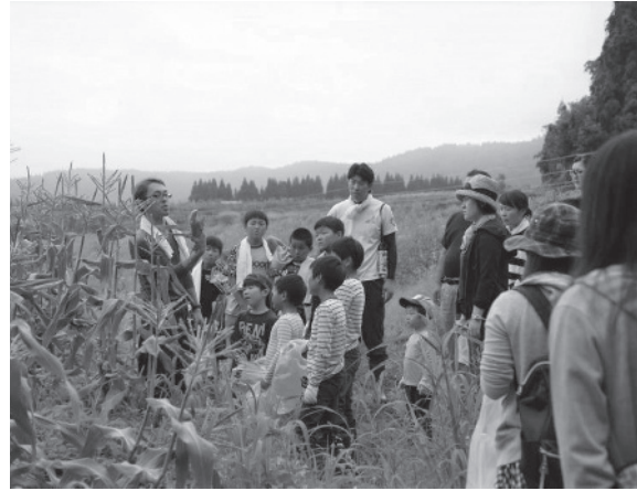
(写真9) スイートコーン収穫体験ツアー(コロナ前に撮影)

点的に防疫に取り組んでおり、獣医師指導の下で消毒槽設置、石灰散布など基本的な対策はもちろん、立入禁止看板の設置による部外者の立ち入り制限、靴底洗浄による汚物除去の徹底等、衛生プログラムの遵守徹底等に努めている。