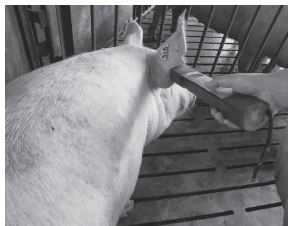
(写真3) イヤータグのICチップデータを読み取るVスキャン