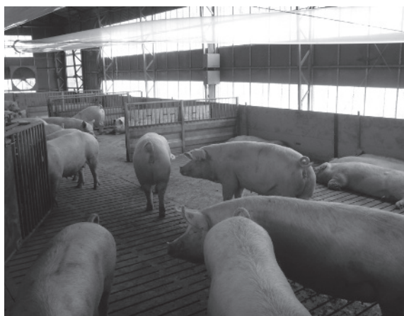
(写真2) フリーストールでのびのびと過ごす母豚

繁殖豚舎は、「44基の分娩ストールを設置した分娩豚房」、「育成豚用の群飼豚房と離乳母豚の種付ストール」、「VELOSを設置した妊娠母豚用フリーストール」の3つのエリアに