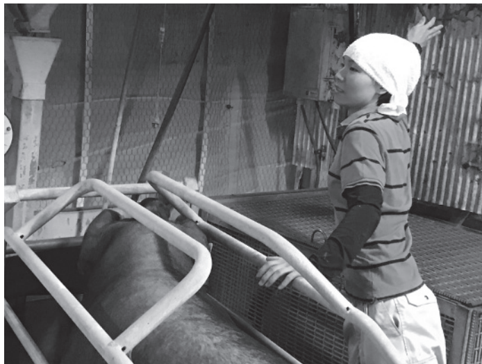
(写真10) 令和3年4月から採用した女性従業員