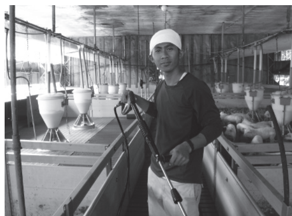
(写真7) 水洗作業をするインドネシア研修生（令和元年9月撮影）

たが、帰国後はそれぞれが自国にて自らが習得した技術を波及させ、地域農業の中心的存在として活躍しており、SNSが発達した現在、今でも多くの研修生と連絡を取り合っている。令和2年以降はコロナ禍で研修生を受け入れられない状況であるが、コロナ終息後にはいつでも受け入れられるように体制を整備している。