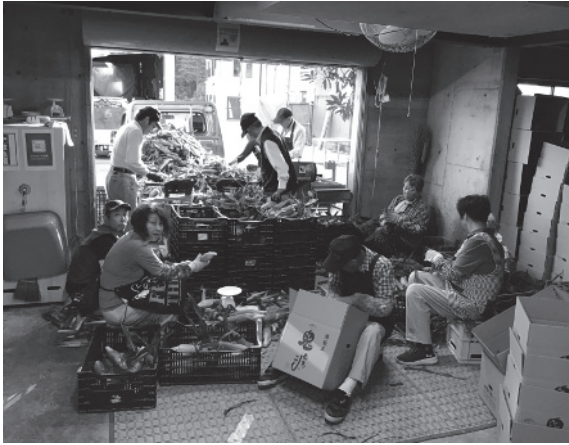
(写真8) 地域住民によるスイートコーンの選別・梱包作業