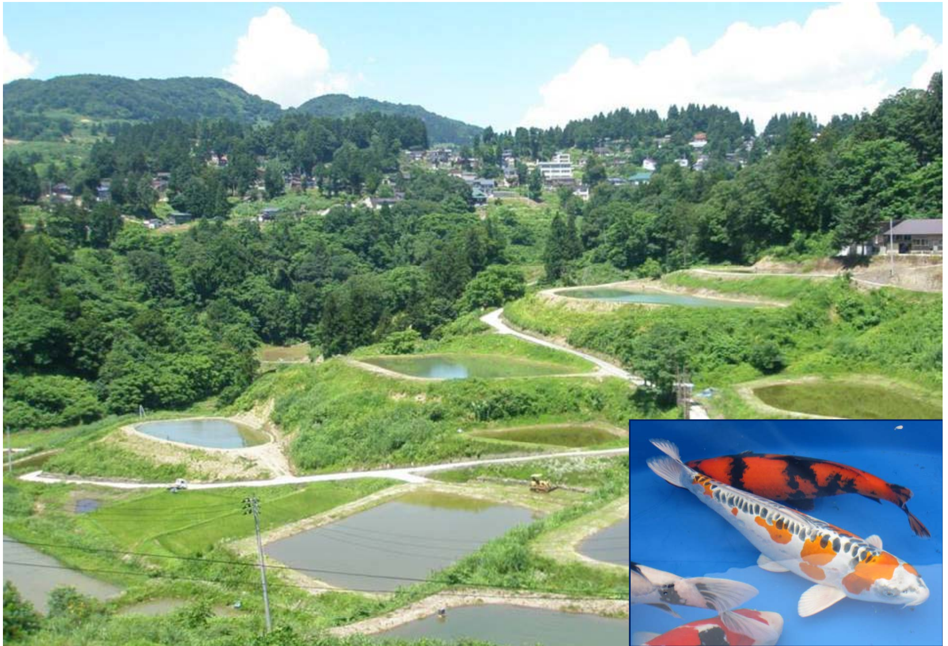
棚田の風景と錦鯉