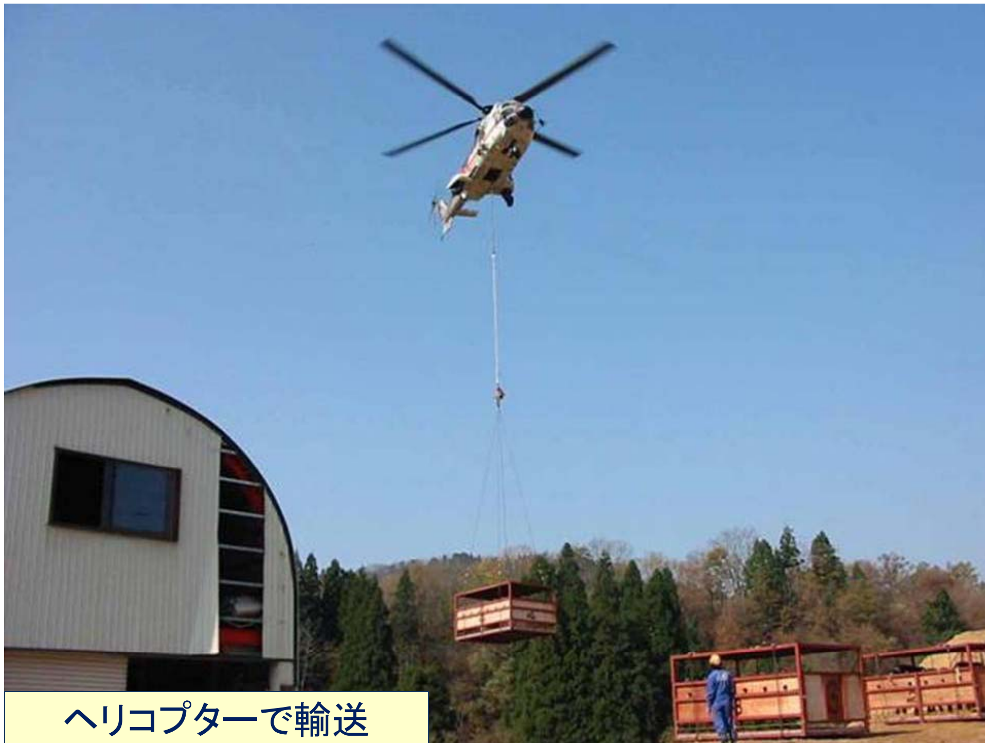
ヘリコプターで輸送