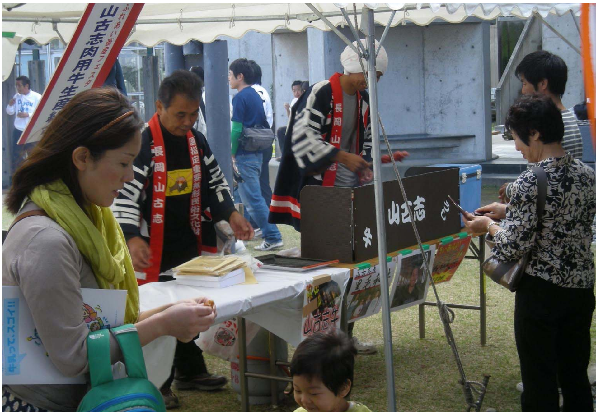
畜産フェスタで「にいがた和牛」の串焼き販売