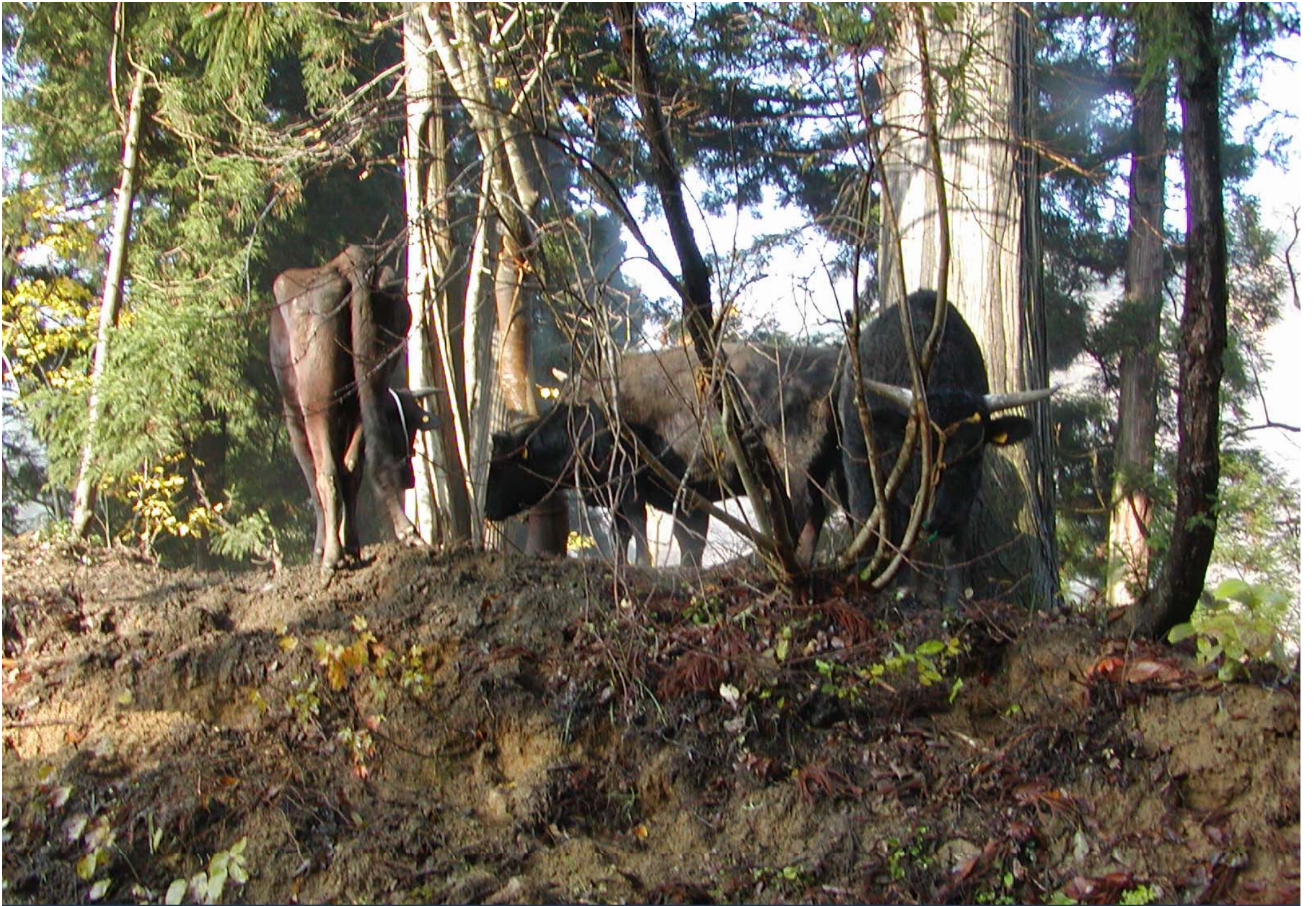
餌を求めてさまよう牛