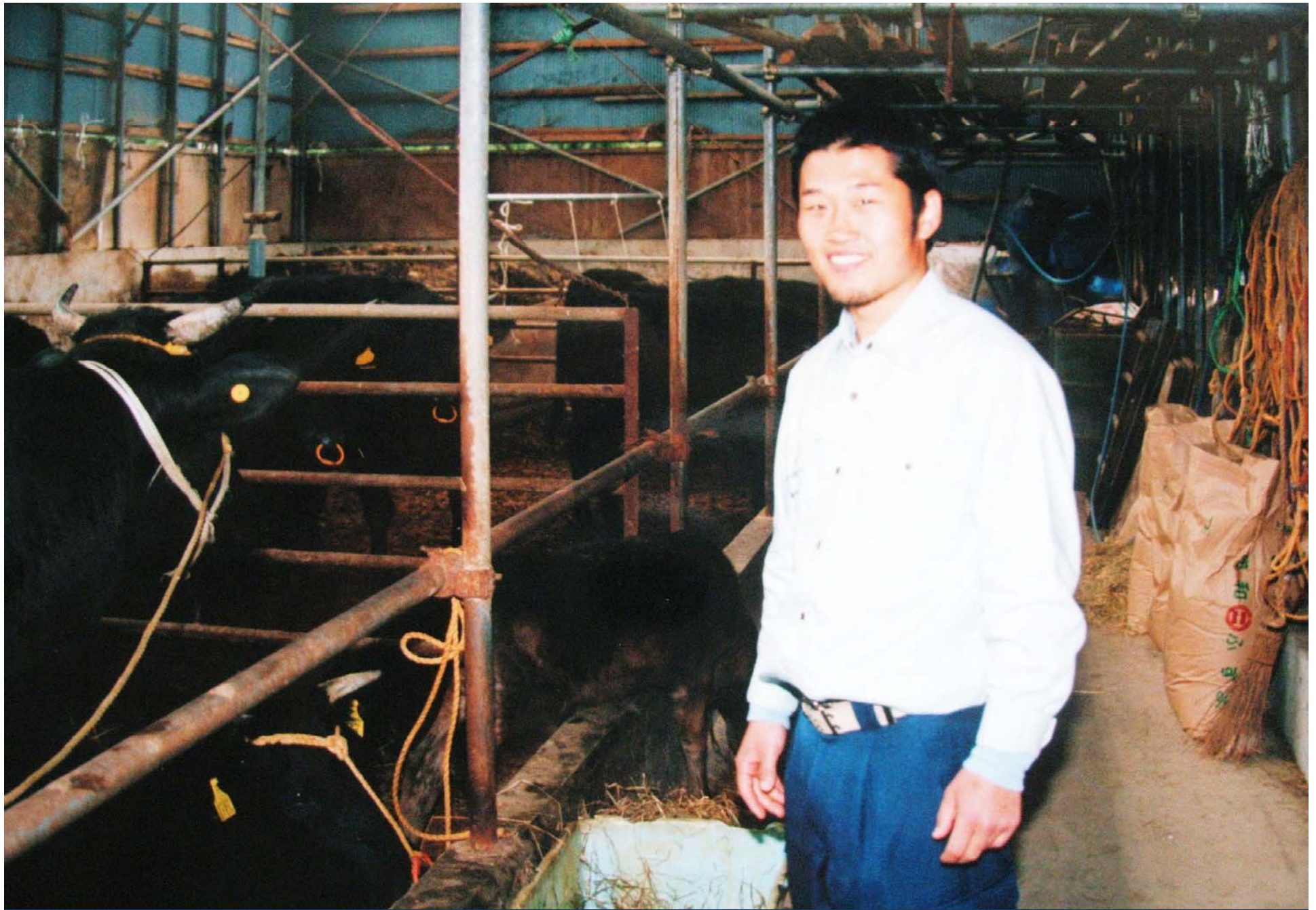
借り牛舎で 救出された牛たちと経営者