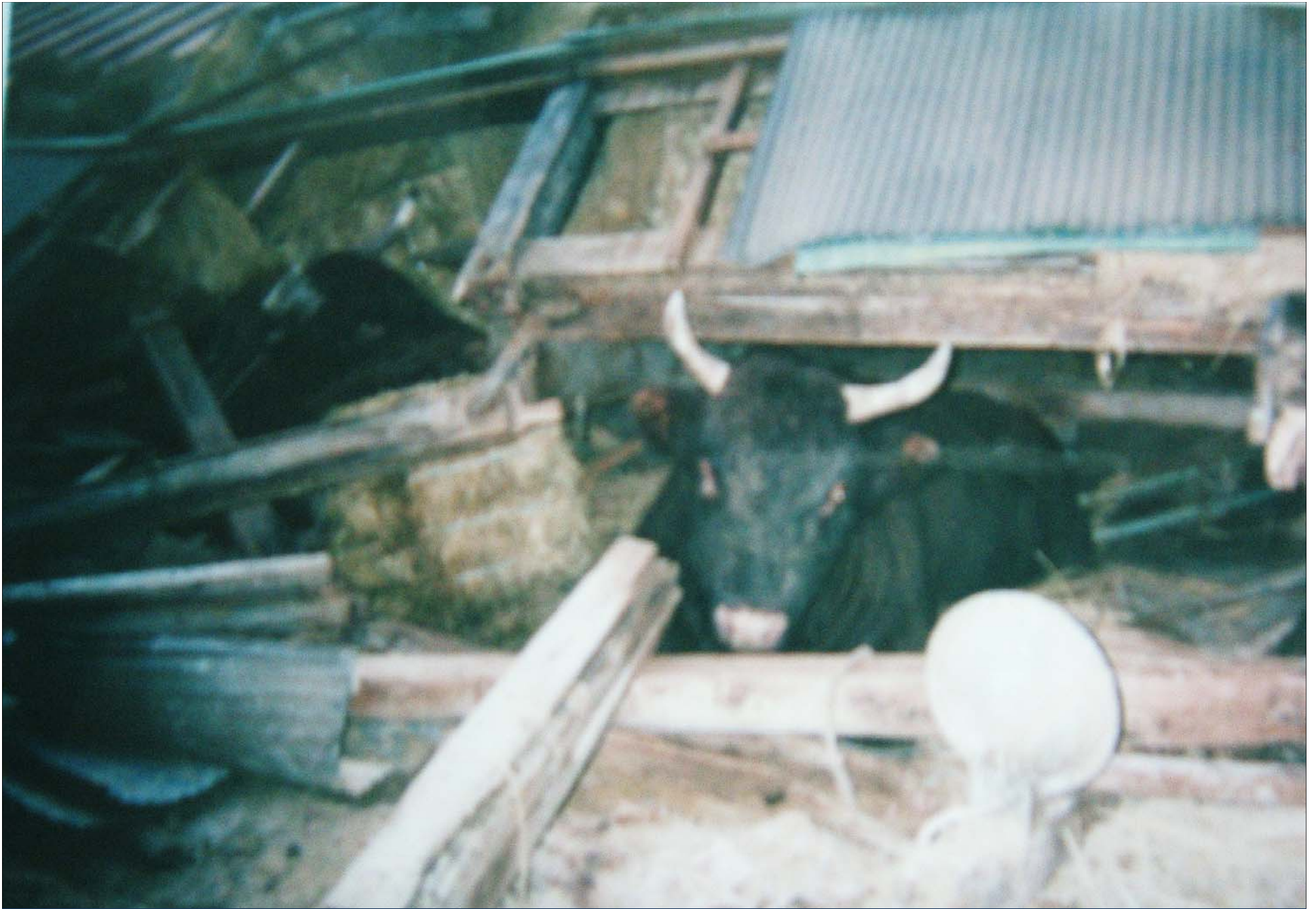
倒壊した牛舎の下敷きになっている牛