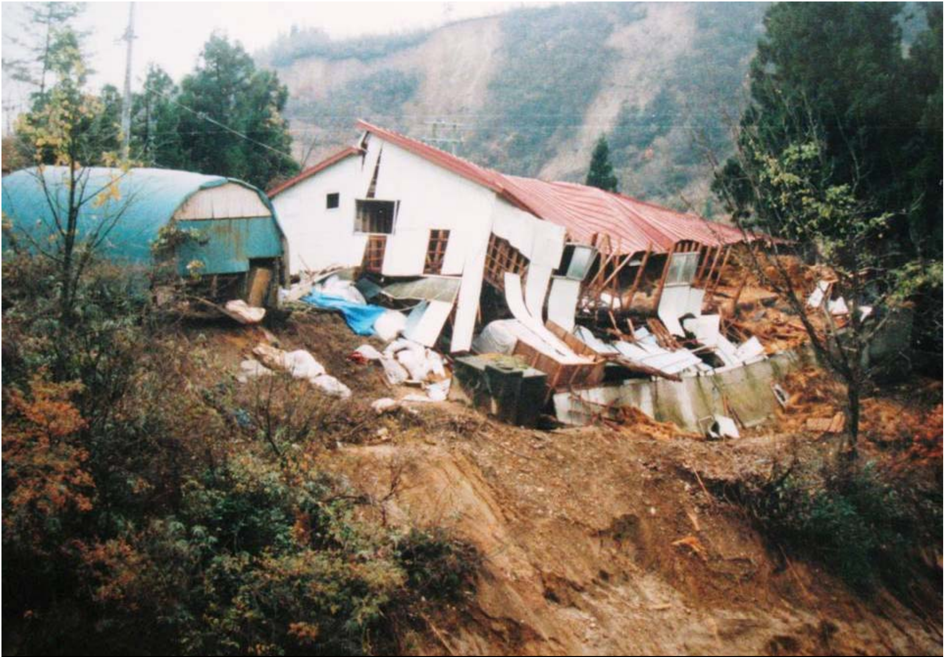
我が家の倒壊した牛舎