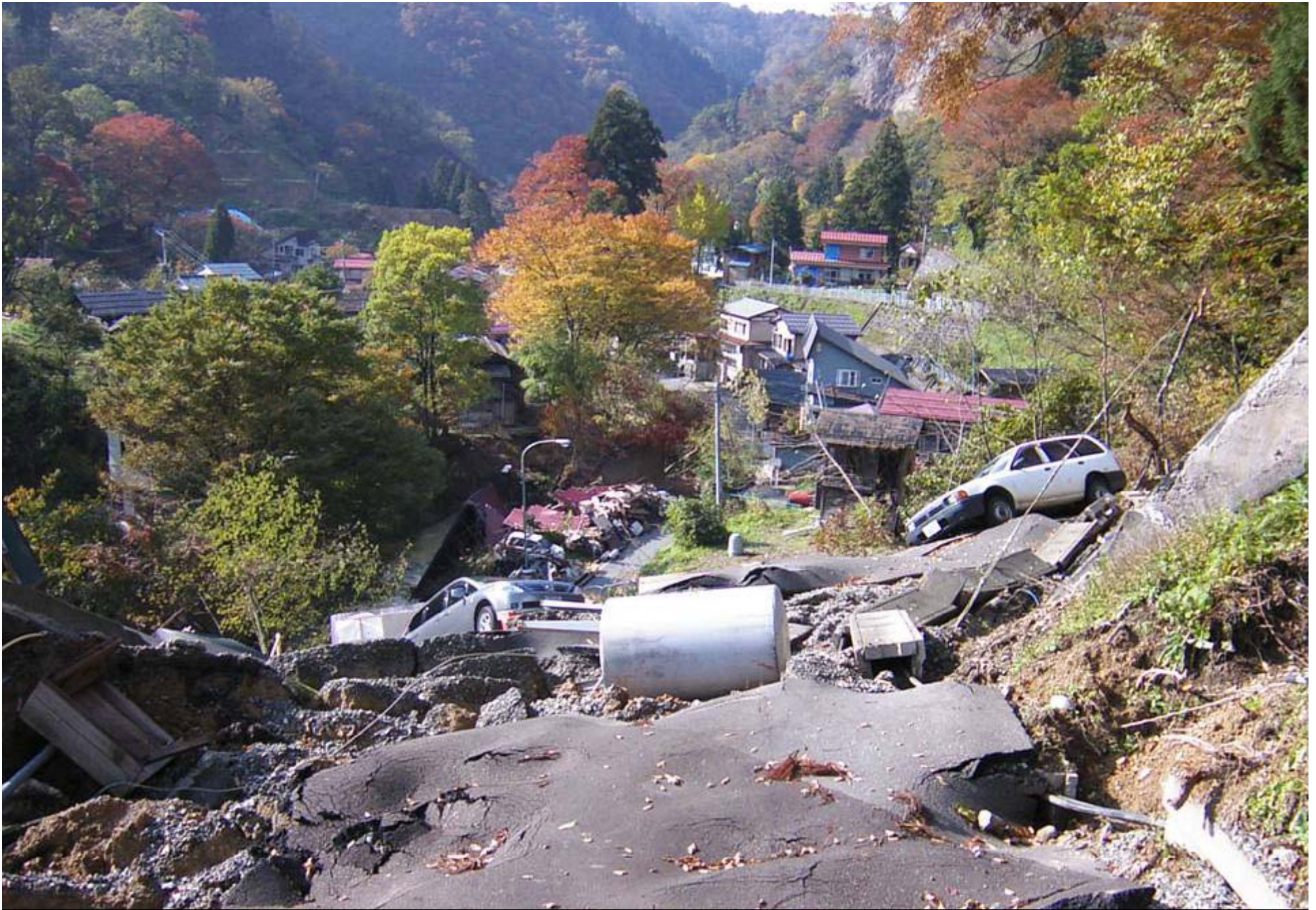
震災直後の山古志