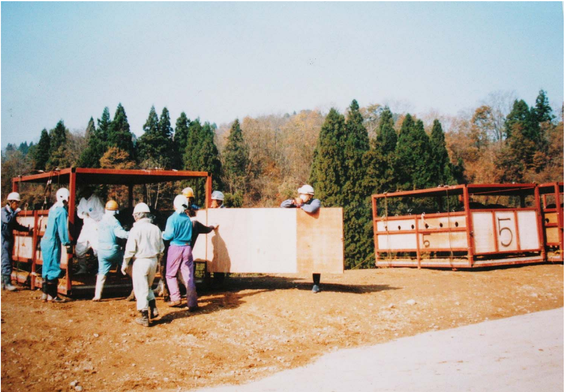
ヘリコプター基地 1コンテナに数頭の牛を入れている