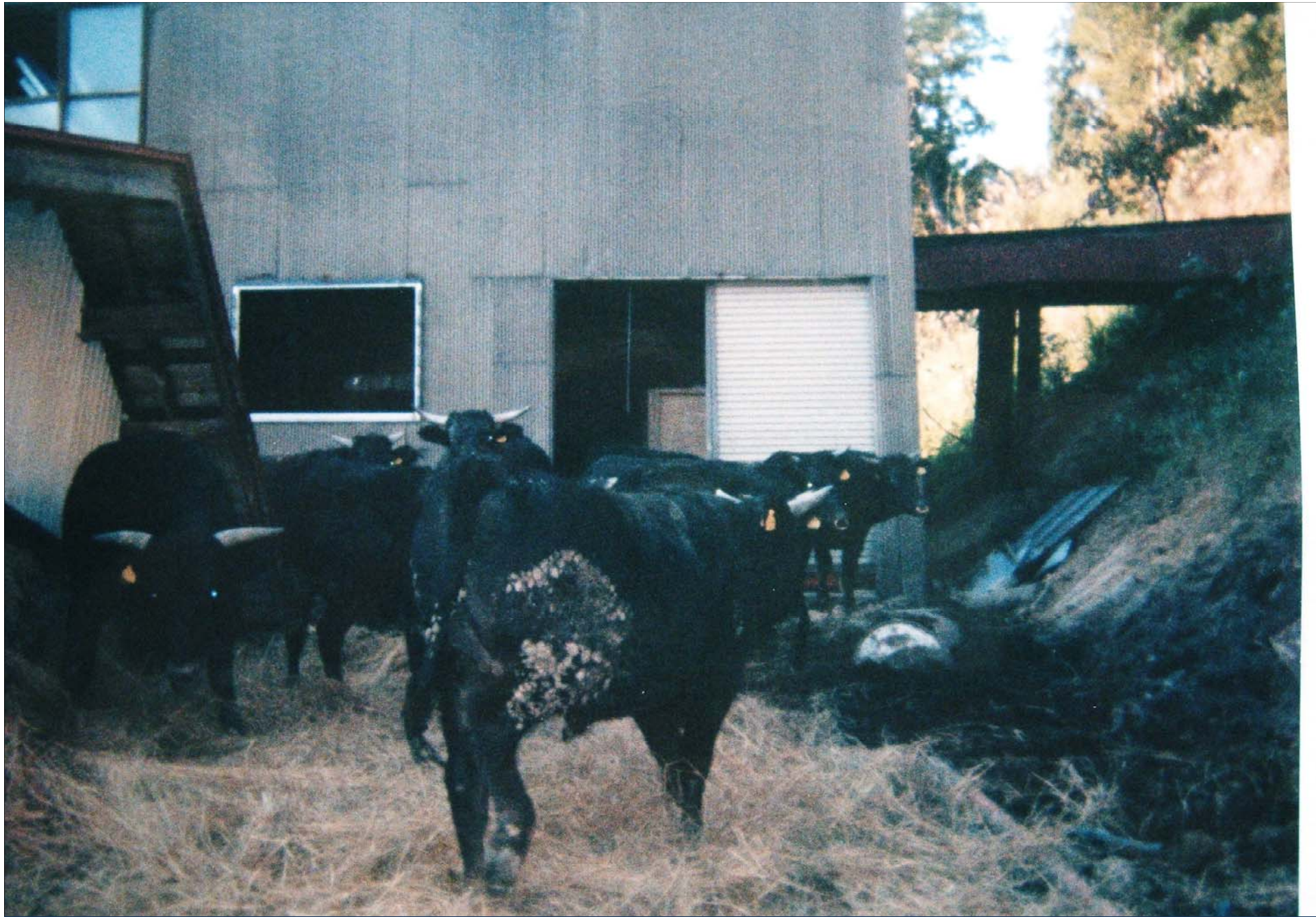
屋外で救出を待つ牛