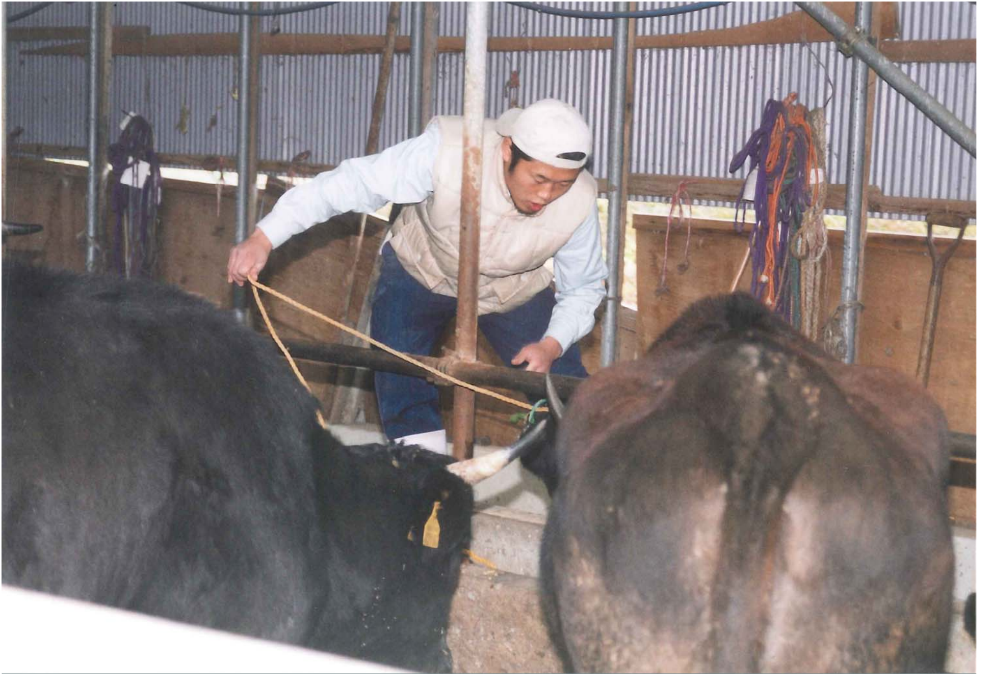
借り牛舎に牛を繋ぐ経営者