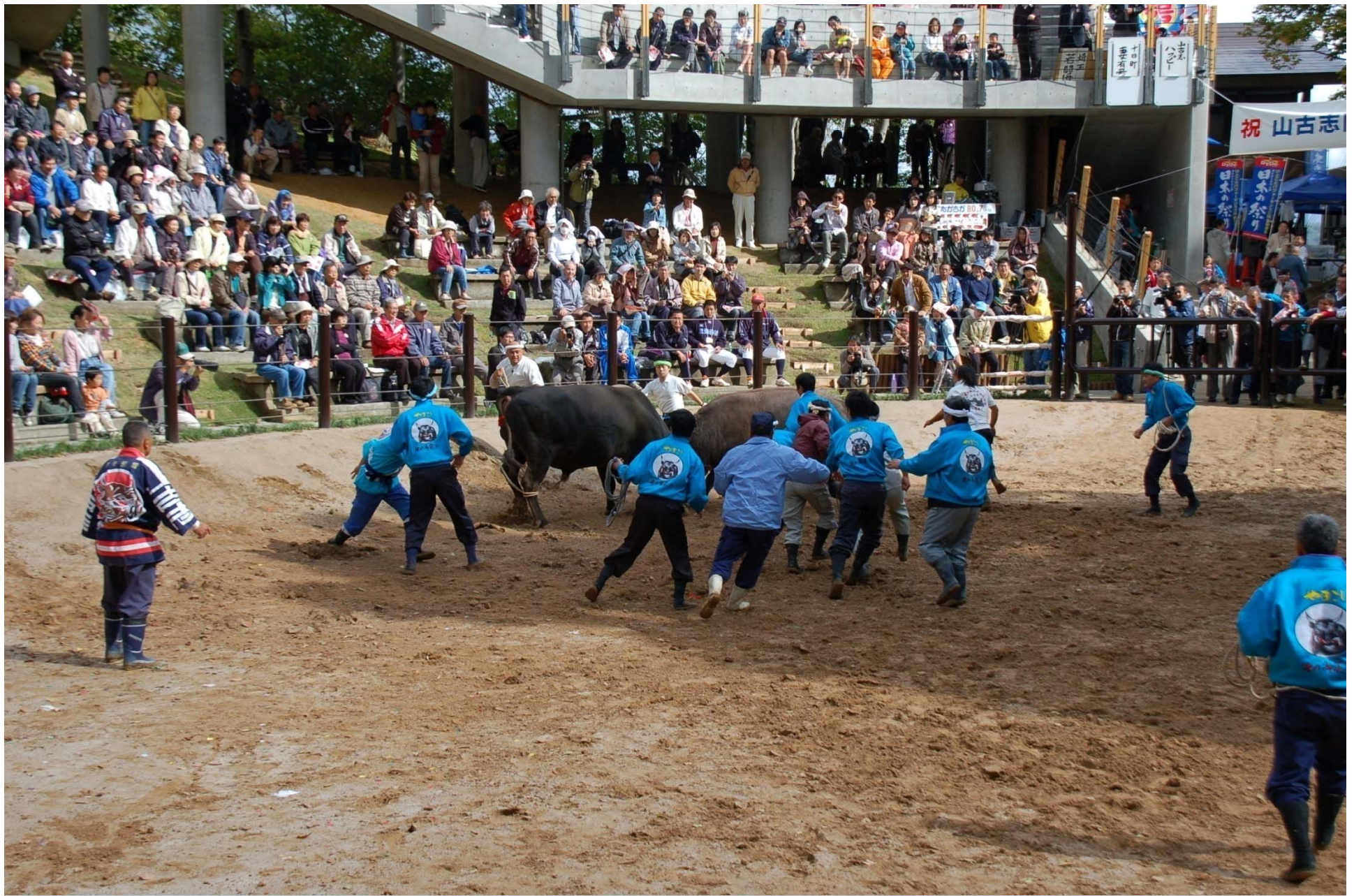
復興した闘牛場と牛の角突き