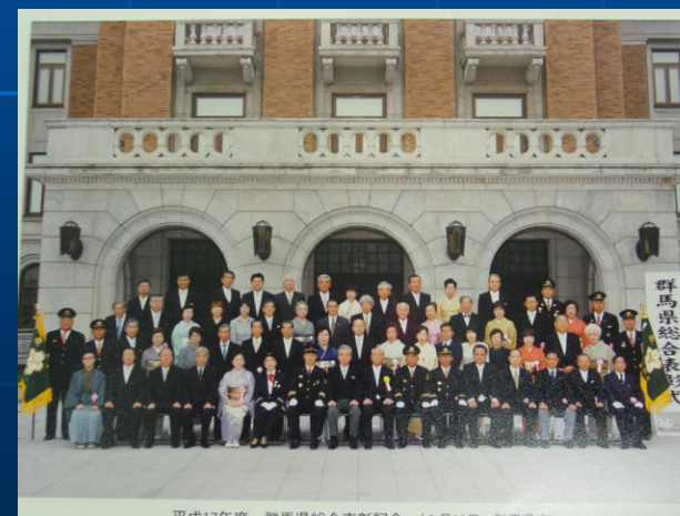
平成17年度 群馬県総合表彰記念 (6月14日 群馬県庁)