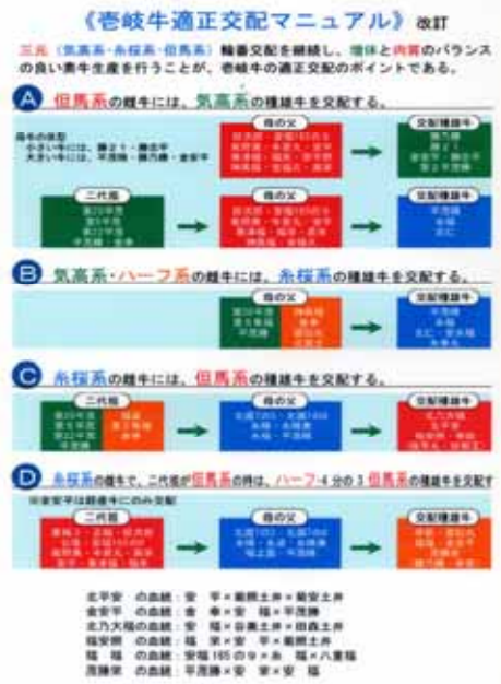
巻岐牛適正交配マニュアル