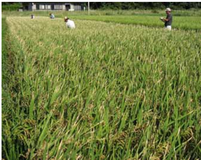
飼料作物の品種選定試験