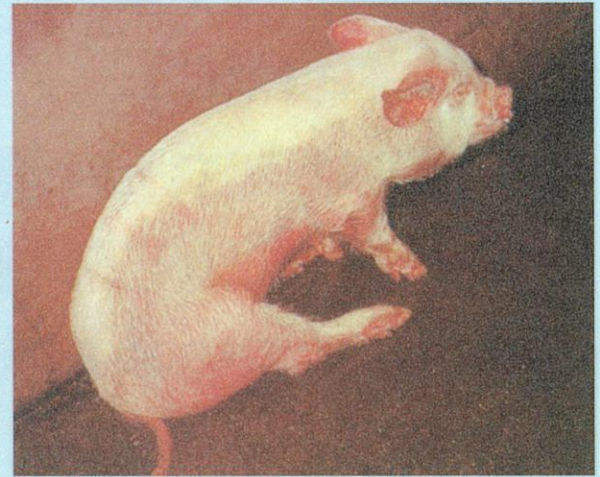
神経症状による起立困難と体表の紫斑