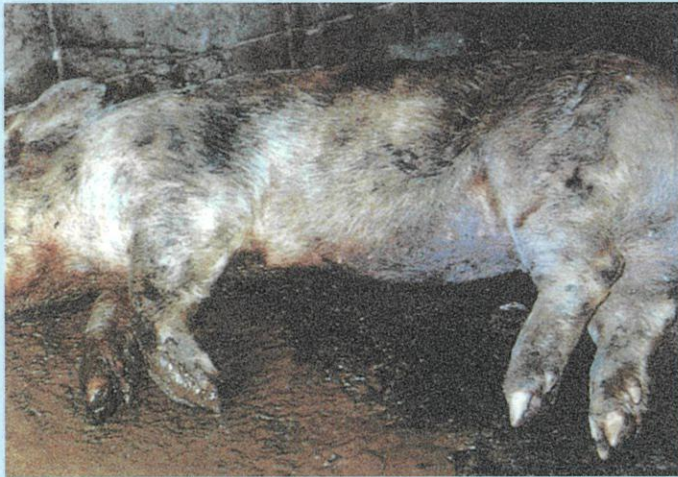
下痢と下腹部の紫斑