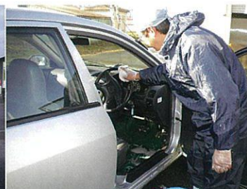
写真16 運転席の消毒