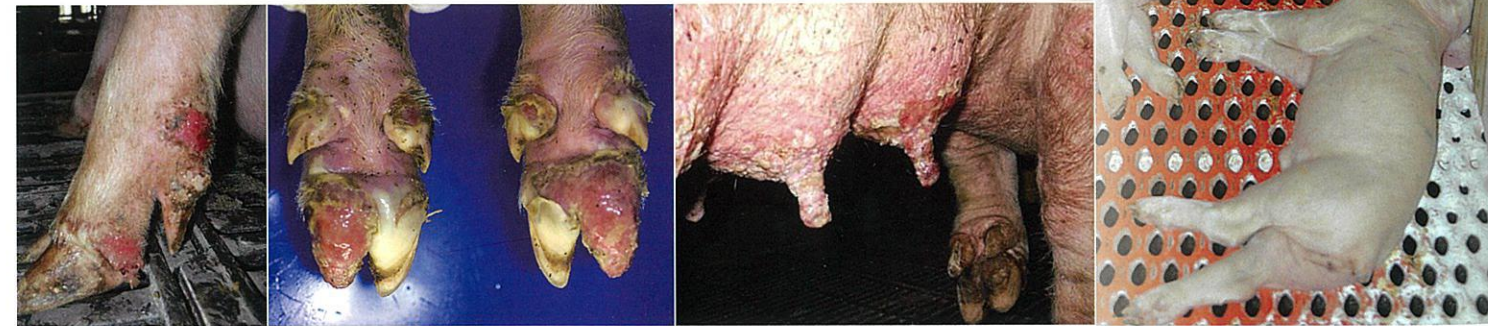
写真9 足の潰瘍と出血