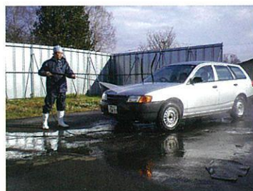
写真15 農場での車両消毒

また、運転席のマットやハンドル等の消毒(写真16)も忘れずにしましょう。運転者などの長靴の消毒も不可欠です。