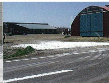
写真18 農場周囲に散布された石灰