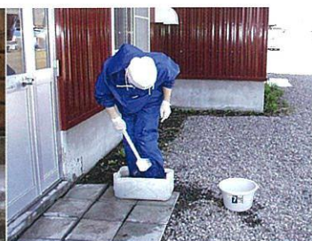
写真14 長靴の洗浄・消毒