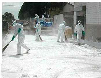
写真17 農場内の石灰散布