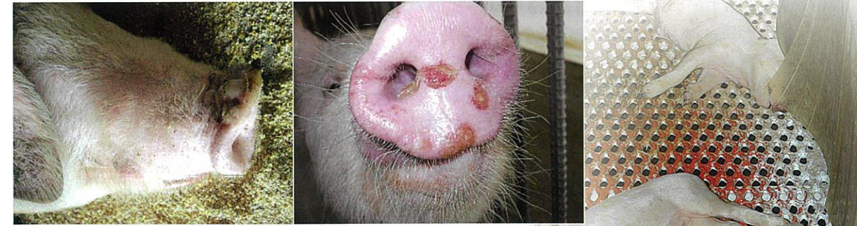
写真7 鼻の周囲の水疱