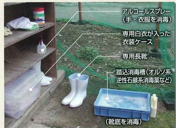
写真4 人を介したウイルス侵入対策