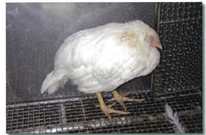
写真2 感染し、元気をなくした鶏