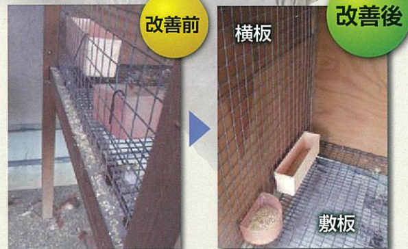
写真3 板を使った餌の散乱防止