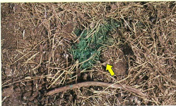
写真1 緑色化した尿 (矢印)