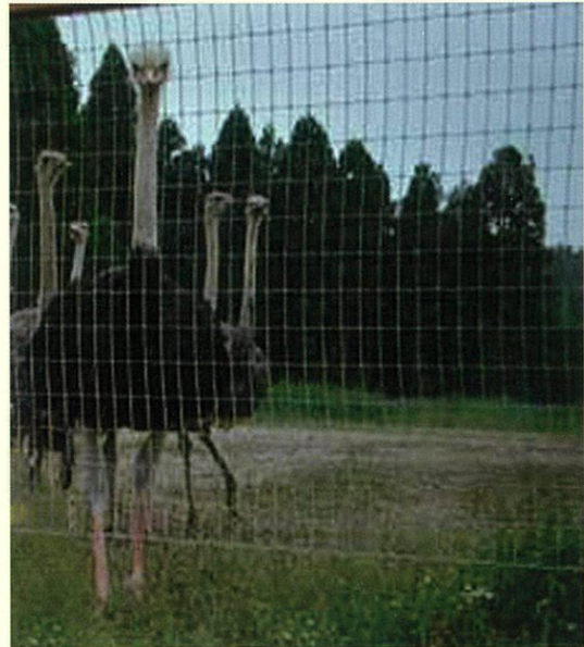
写真 金網で囲まれた中で飼育されているダチョウ