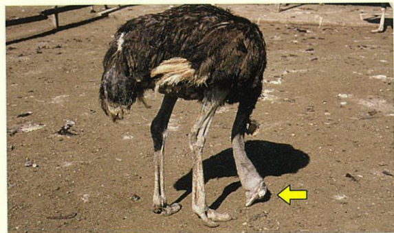
写真2 ニューカッスル病に感染した時の神経症状 (頭(矢印)を下にしている)。本病に感染した場合も同様の症状が見られます。