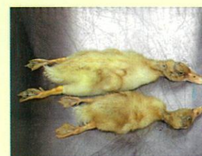
(写真) 上：9日齢の正常アヒル。 下：3日齢アヒルに高病原性鳥インフルエンザウイルス山口株を接種し、6日後の9日齢で死亡したアヒル。