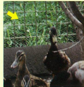
(写真) 目の細かい網(矢印)を張って、野鳥との接触を避ける。