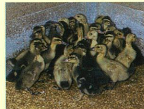
(写真1) 新しい敷料で飼われているアイガモ。